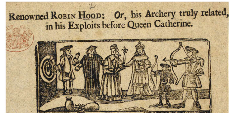
Renowned ROBIN HOOD, British Library, datiert 1741-1762

Da werdet ihr doch sicher auf 100 Yard ein großes Bild treffen...